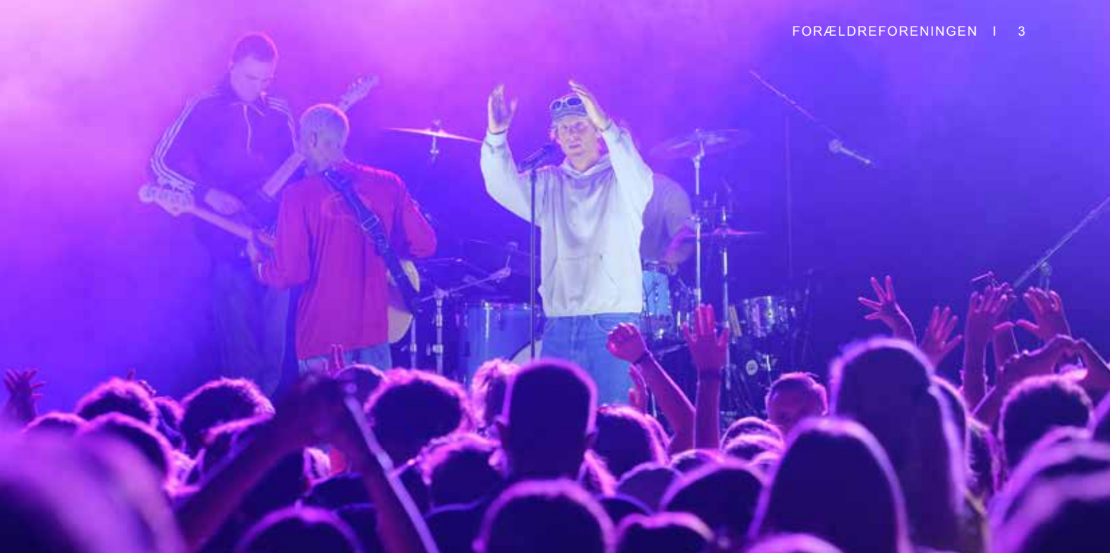
Scarlet Pleasure til SGønfest 2022, hvor Forældreforeningen vanen tro stod i garderoben.