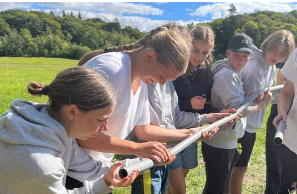
Teambuilding ved årets SGYmpiade.

væld af sociale aktiviteter og udfordringer med det formål at fremme de sociale relationer på tværs af årgangene.