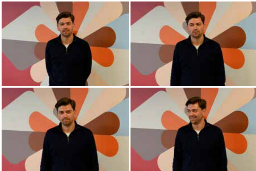
Det kræver mange kasketter at være iværksætter.

mennesker, jeg er fascineret af, er mennesker, der er dedikerede og drevet af noget. Folk, der nørder med noget, synes jeg, er interessante. Det er typisk nogle, der er dedikerede til en faglighed og bliver gode medarbejdere.