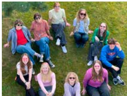
Dele af SGoops redaktion.

dig tage ansvar for at videreudvikle det rummelige, forskelligartede og dynamiske fællesskab, der præger SG. I den forbindelse er det glædeligt, at de nationale trivselsundersøgelser, som årligt gennemføres på alle danske ungdomsuddannelser, indikerer, at vi her på SG i høj grad lykkes med denne ambition. År efter år er vi nemlig blandt de allerbedste ungdomsuddannelser i Danmark målt på elevtrivsel. Så flotte resultater må bl.a. tilskrives vores stærke fællesskab her på SG. Det kan vi godt være stolte af."