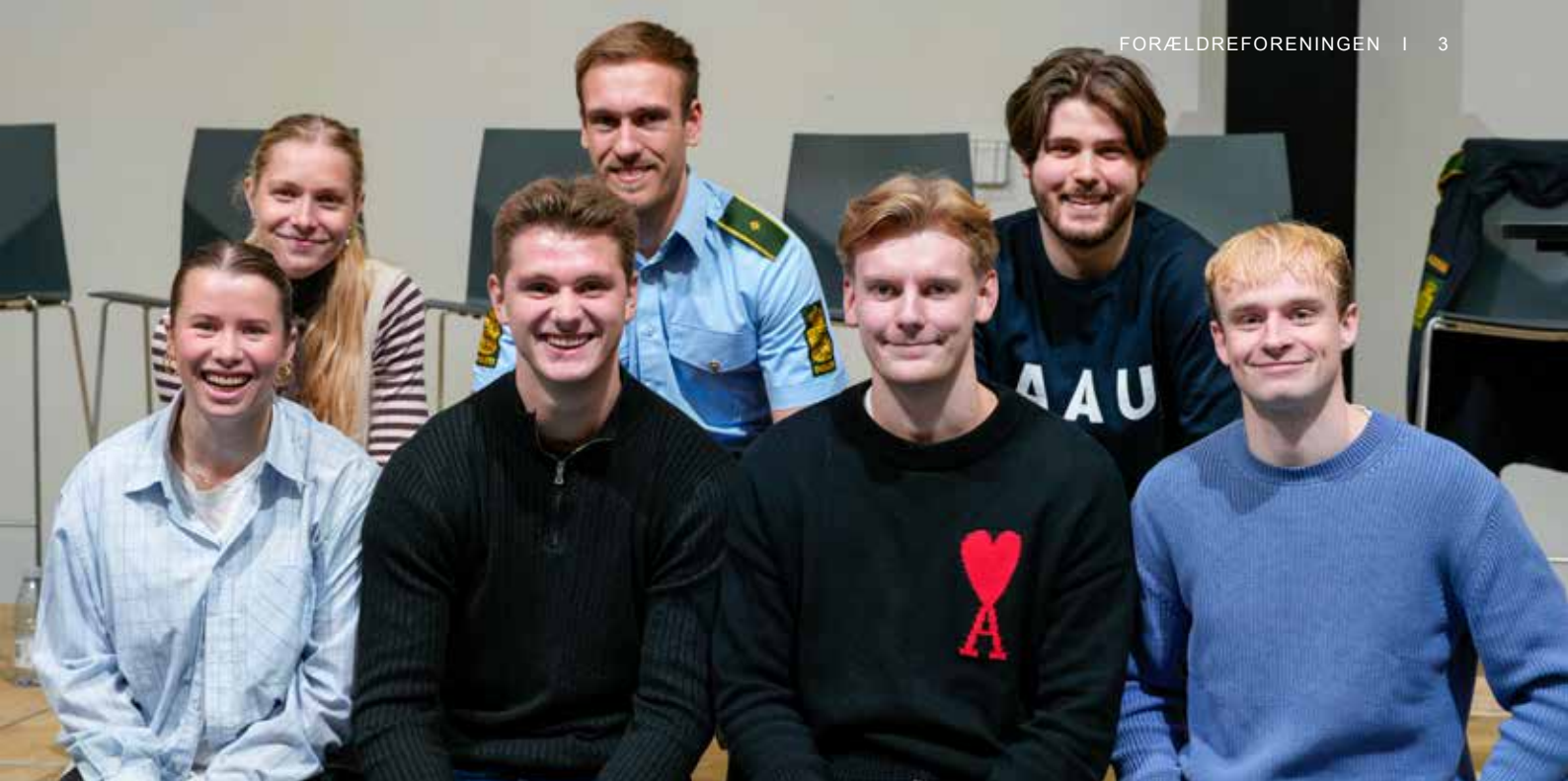
I forbindelse med temadagen "Klar til voksenlivet" havde vi besøg af en række tidligere SG-elever, som fortalte om livet efter gymnasiet.