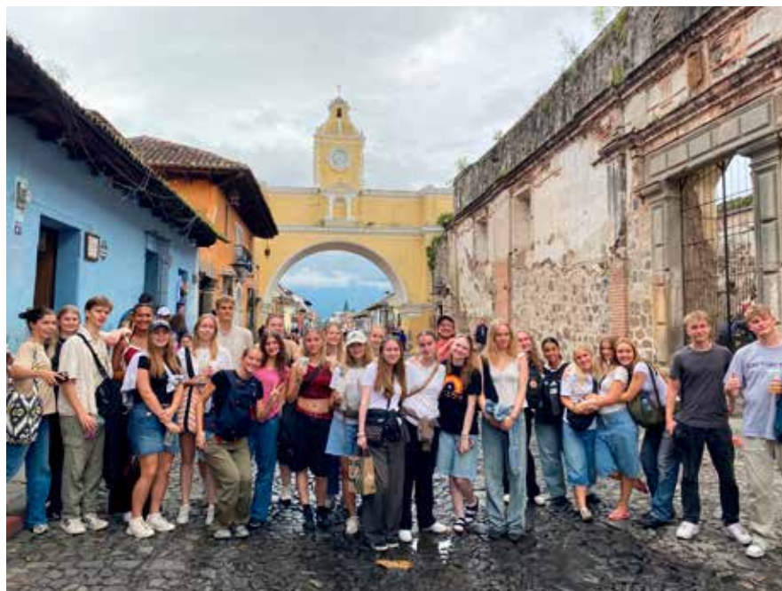
3.a på studietur til Guatemala.

Med de store klimaudfordringer vil det være naturligt at stille spørgsmålstegn ved, om det er nødvendigt, at vores elever rejser ud i verden i skolesammenhæng. Det er klart, at vi som gymnasium skal arbejde på at begrænse vores klimaftryk mest muligt – også i rejsesammenhæng. Derfor foregår mange af rejserne også med bus eller tog. Men når vi rejser ud i verden, er der jo faglige grunde til at vælge netop de rejsemål, som vi hvert år har. Og der kan være vigtige faglige grunde til at vælge et rejsemål, som man er nødt til at flyve til. Som når eleverne fra 2.z har været på studieophold i Boston i efteråret med syv ugers undervisning på Bunker Hill Community College. Eller som vores internationale sproglige studieretning, der var 14 dage i Guatemala med privat indkvartering.