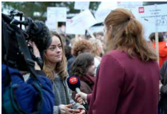
SG-elever i demonstration mod regeringens nye taxameterudspil.

Siden vores elever i 1.g for efterhånden længe siden mødtes i rundkørslen foran gymnasiet for første gang, er det nu blevet efterår. Og eleverne er ved at falde til i deres studieretningsklasser. Siden den første skoledag er eleverne blevet hjulpet på vej til at blive en del af en ny verden, hvor man langsomt bliver en del af fællesskabet. Både det store gymnasiefællesskab, men også, og måske især, klassefællesskaber og faglige, sociale eller interesseskabte fællesskaber.