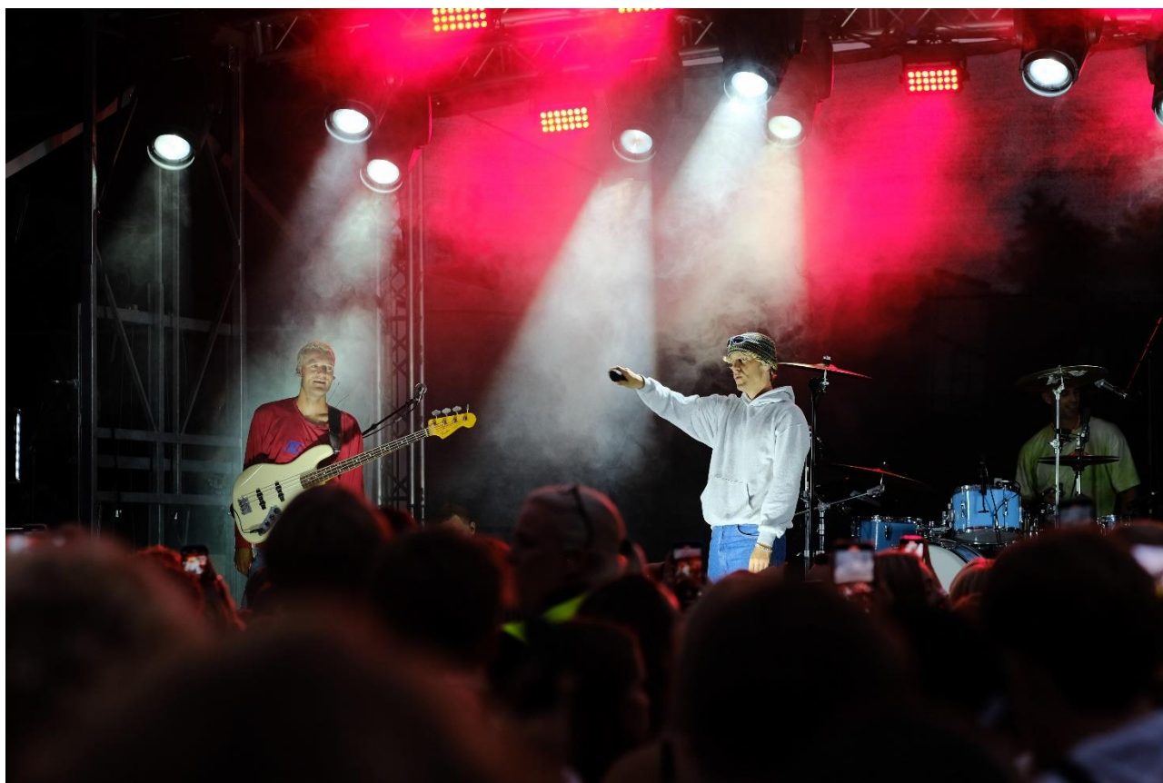
SGønfesten 2022 bød bl.a. på koncert med Scarlet Pleasure.

Igen i år afholdt vi vores egen musikfestival, SGønfesten, i starten af skoleåret. SGønfesten afholdtes på sportspladsen og indeholdt en række sociale aktiviteter, fællesspisning og livemusik ved 11 forskellige elevbands. Festen inkluderede også en koncert med bandet Scarlet Pleasure