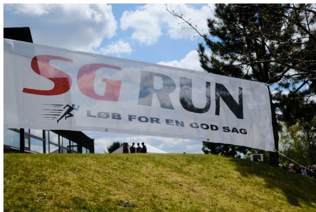
Velgørenhedsløbet SG Run 2023.