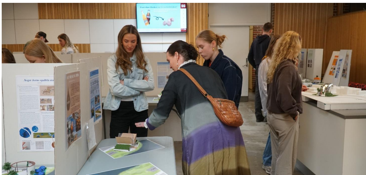
SG's design- og arkitekturhold holdt fernisering i foråret 2023 med deres modeller til et nyt Jørn-museum, og repræsentanter fra museet mødte op for at se og vurdere de mange kreative forslag.