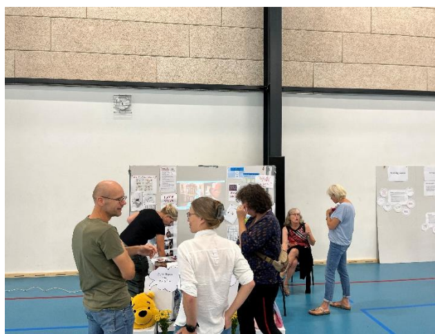
SG-messe for lærerne, august 2022.