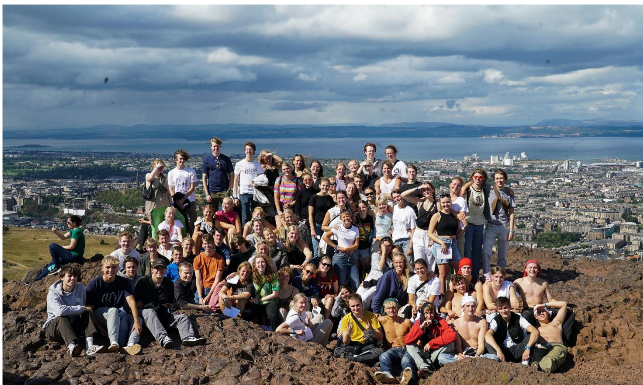
Musikklasserne fra 3.g på studierejse til Edinburgh. Her på vandretur til toppen af Arthurs Seat.

De internationale koordinators tager i slutningen af skoleåret til en konference i København om "Global Citizenship", hvor der er fokus på, hvordan bl.a. Rysensteen Gymnasium har implementeret en højere grad af kulturlæring i undervisningen gennem kulturforløb og studierejser med udveksling.