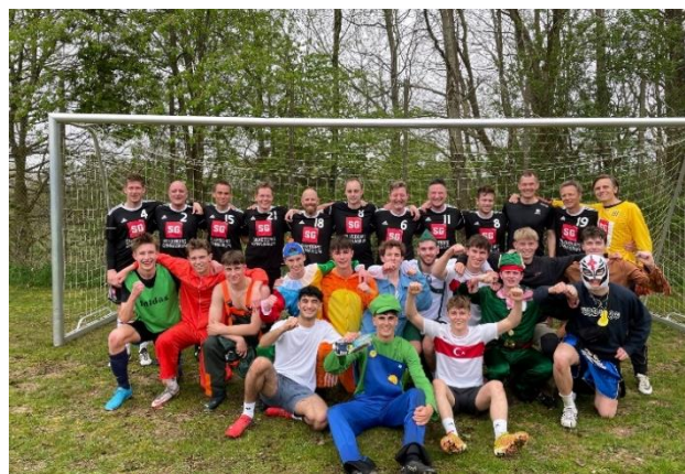
Billeder fra sidste skoledag 2023.