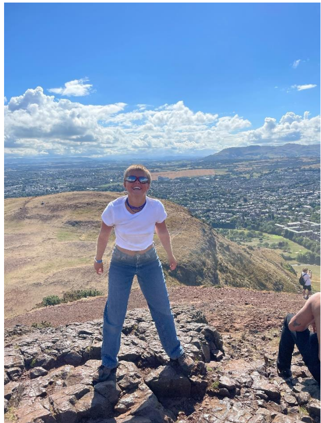
Billeder fra fotokonkurrencen blandt eleverne efter studierejserne 2022.