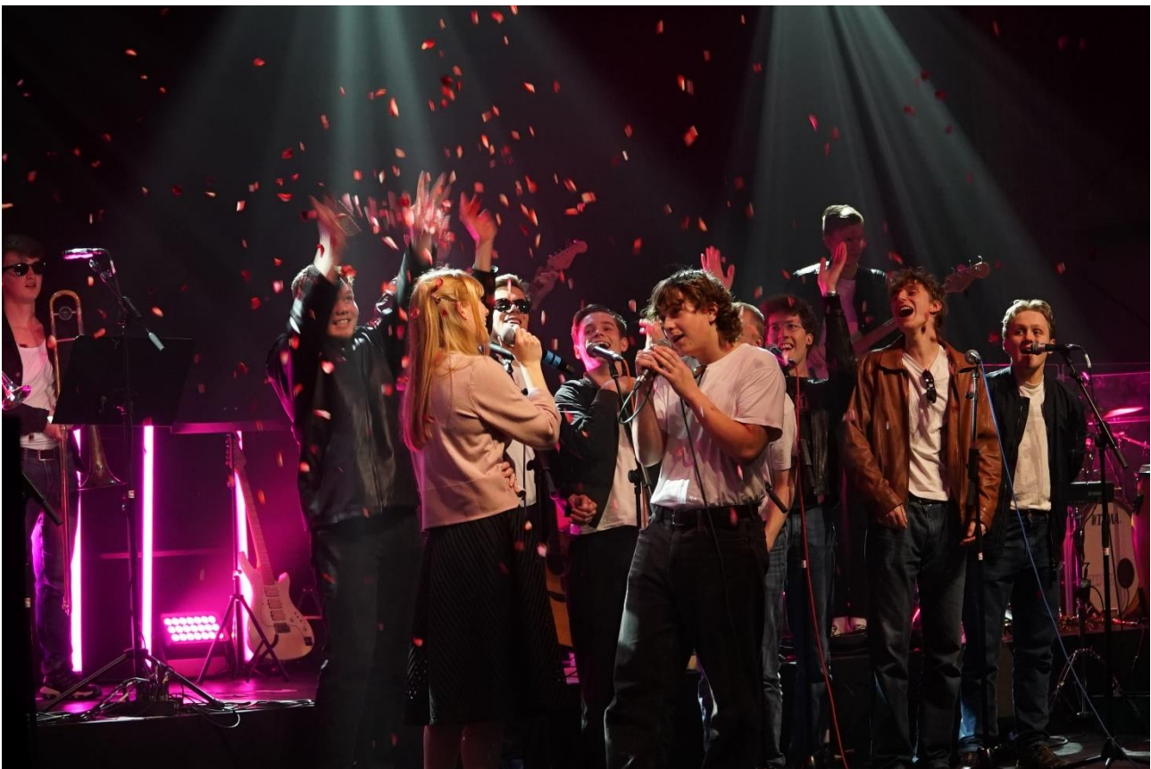
3d med en jubilæumshyldest til filmen GREASE i forbindelse med forårskoncerten 2023.

Som erstatning for den traditionsrige julekoncert afholdtes der i år en forårskoncert med indslag fra musikstudieretningerne, valgholdene og bigbandet. Forårskoncerten var særdeles velbesøgt med et publikum på ca. 750 personer.