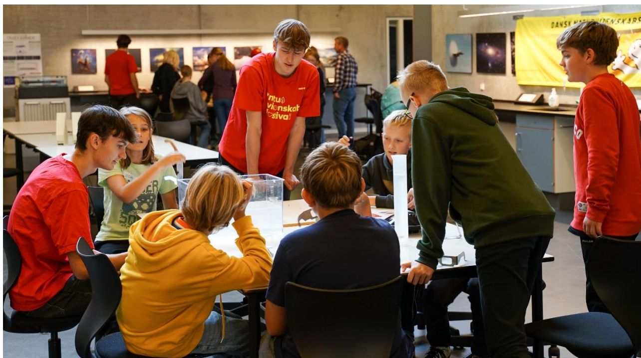
Naturvidenskabsfestival for grundskoleeleverne, oktober 2022.

Siden 2007 er den landsdækkende Naturvidenskabsfestival i uge 39 bl.a. blevet markeret med besøg af elever fra 6. klasserne i Silkeborg Kommune. I 2022 deltog ca. 900 folkeskoleelever fordelt på 21 skoler fra hele Silkeborg Kommune. Dvs. at der kun er ganske få af kommunens skoler, som ikke kommer på besøg i løbet af ugen. Arrangementet byder for hver elev på et kemishow samt fire forskellige workshops med varierende naturvidenskabeligt indhold under overskrifterne Kroppens univers , Vingummi , Lysets mysterier samt Bæredygtighed . Aktiviteterne varetages af 14 af gymnasiets lærere sammen med ca. 150 af gymnasiets egne elever. Gymnasiet modtager udelukkende positive tilbagemeldinger fra både 6. klasse-eleverne og deres lærere efter arrangementet.