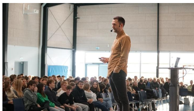
Nogle af dette skoleårs fællesarrangementer på SG.