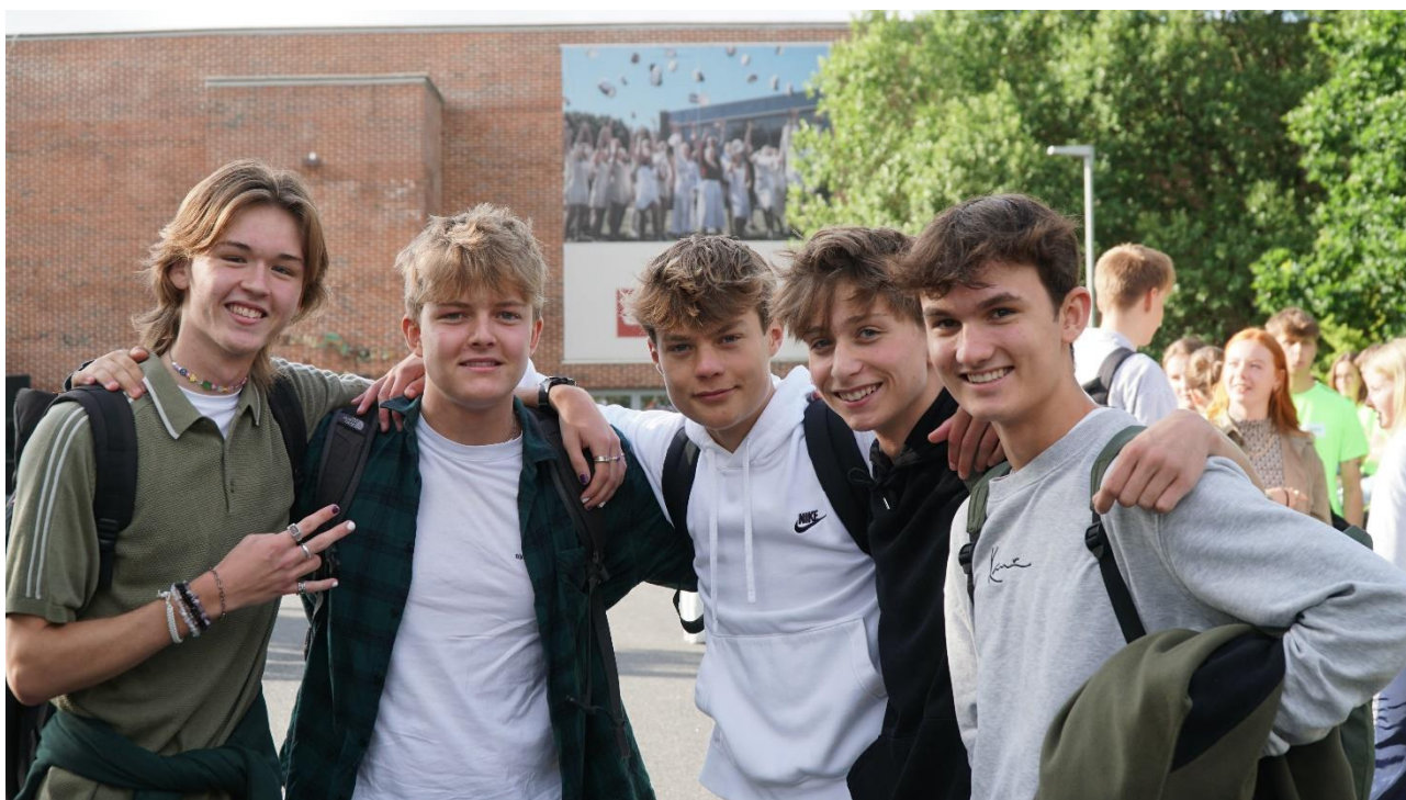
Forventningsfulde 1.g-elever klar til første skoledag i august 2022.

Introudvalget har planlagt og afviklet intro-arrangementer i form af første skoledag, tutorordning, intro-tur, SG After Dark mv. Til hver 1.g-klasse har været knyttet to ældre elever som tutorer. For at fremme forståelsen for gymnasielivet og kommunikationen på tværs af årgangene har tutorerne haft en tydelig rolle, fx på første skoledag og ved introturen i starten af studieretningsforløbet. Introaktiviteterne evalueres særdeles positivt af 1.g'erne i forbindelse med grundforløbsevalueringen.