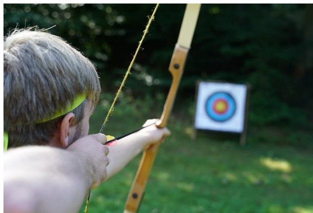
SGympiade på Sletten, august 2022.