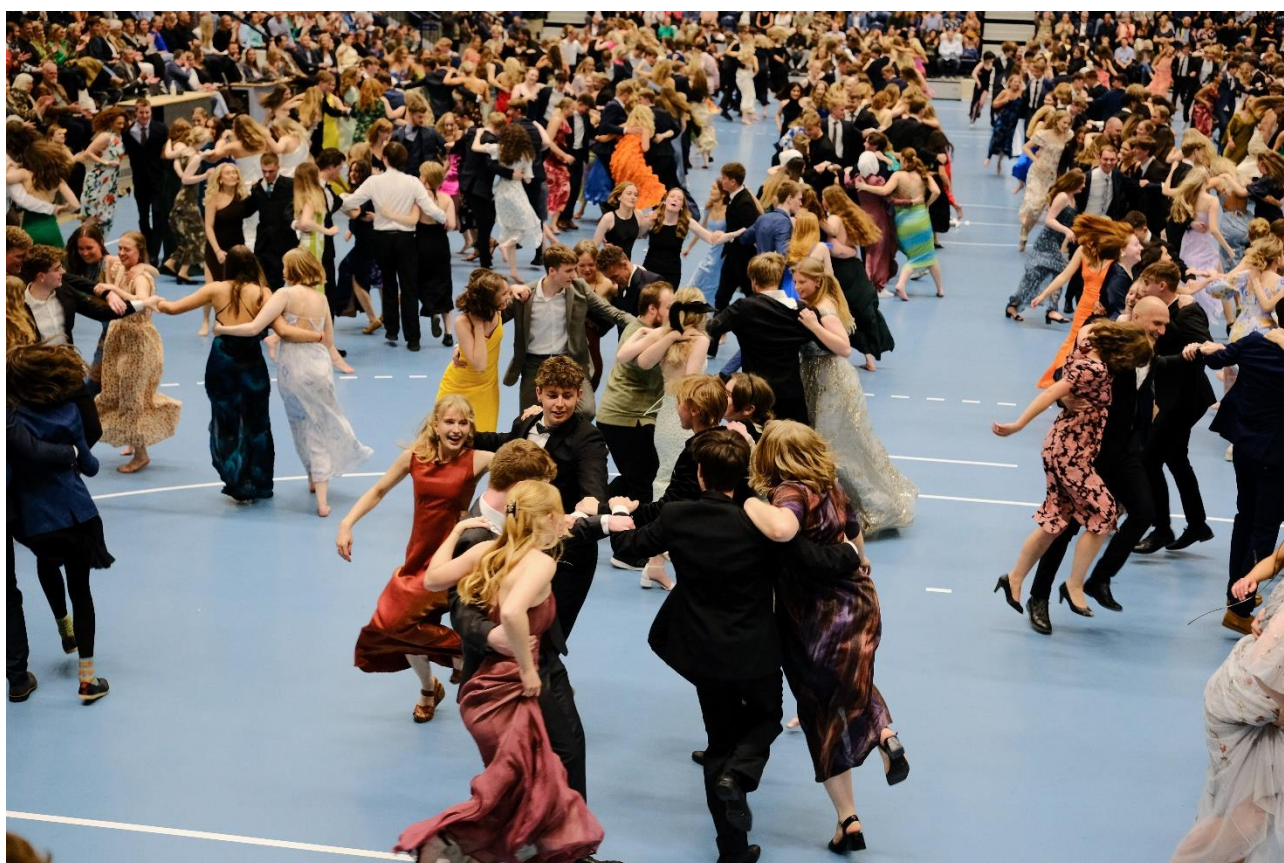
Lanciersarrangement i JYSK Arena 2023.