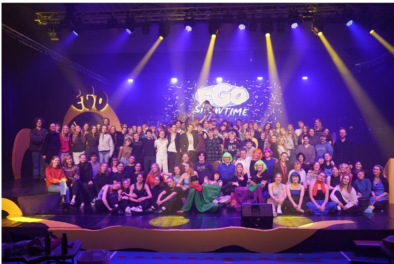
Årets teaterkoncert, "(EGO) Showtime!"